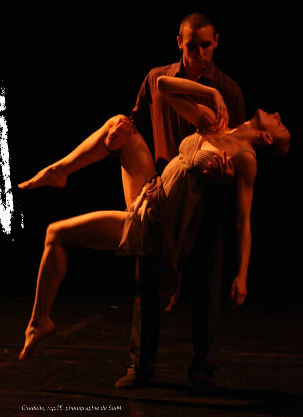
Citadelle, ngc25