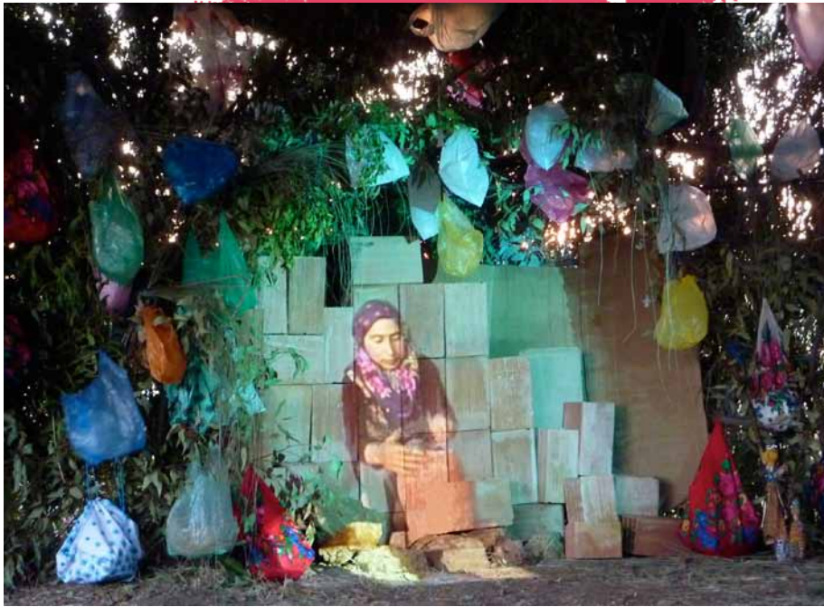
Laaroussa, installation vidéo, La Luna