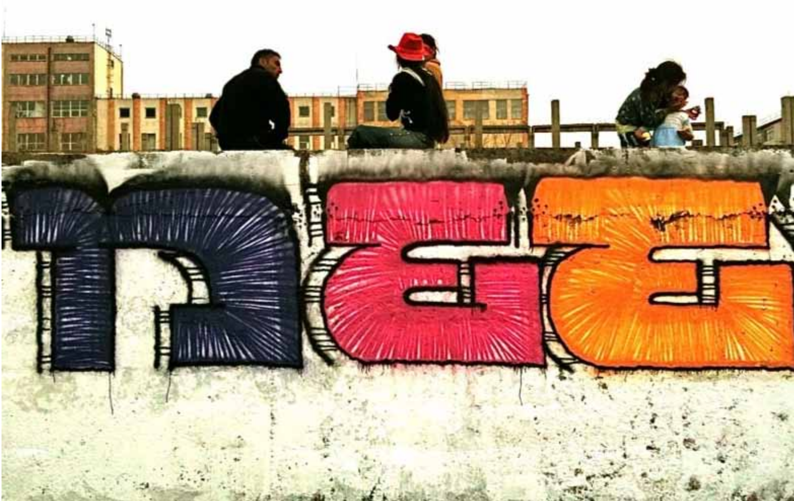
Nantes Europe Express, Gypsy Graff, Bucarest

Dimanche 25 septembre de 15h à 19h, Cosmopolis