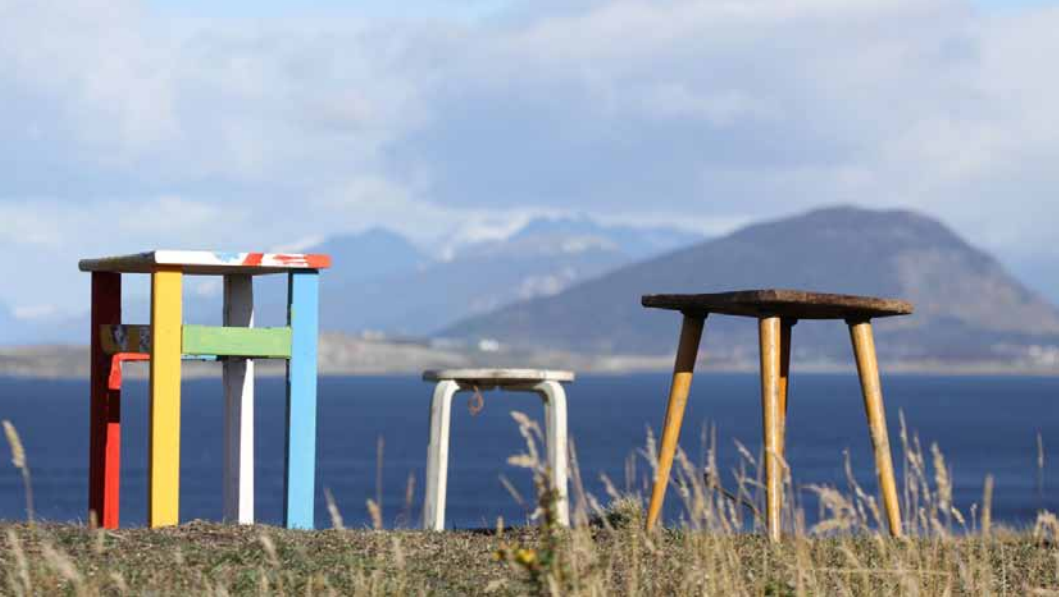
Des rives continentales, collectif IWWW